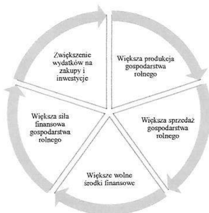
Rys. 2. Oddziaływanie siły finansowej w gospodarstwie rolnym

Z uwagi na charakter pojęcia siły finansowej gospodarstw rolnych nie można nadal mówić o jednoznaczności definicyjnej w tym zakresie, gdyż wykazano, że siła finansowa ma niedookreśloną naturę, a jej powstawanie i kreowanie jest uzależnione od posiadania informacji płynących z rachunkowości rolnej i przyjętego podejścia przez badacza. Jej mechanizm oddziaływania na gospodarstwo rolne przedstawiono na rys. 2. Ponadto wyodrębnienie kilku rodzajów siły finansowej powoduje, że jej pomiar może odbywać się zarówno za pomocą tylko jednego miernika lub większej ich liczby, a wtedy staje się zagadnieniem złożonym.